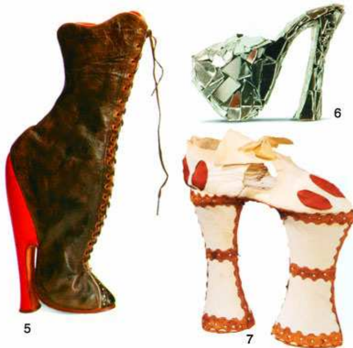
5. Inglaterra, año1890, 6. Lars Hagen, año 1991.7. Italia, año1600 (www.avisora.com)