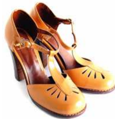
Diseño Vintage de los 70 y 80

La disposición anatómica y geográfica de los Pies, al final del cuerpo, conspira fuertemente en las prioridades de sus cuidados higiene y confort, en la edad de la adolescencia en adelante los zapatos son parte de la moda y aceptación social para luego ser una poderosa arma de la seducción y cuando llegan a la edad senil o adultos mayores el zapato se transforma en un problema al no poder disfrutarlos y tener que acudir a los zapatos especiales y funcionales mirando con resignación el closet donde se guardan los zapatos que alguna vez fueron sus cómplices. Algunas mujeres no aceptarán y se revelarán a su condición y estado de sus pies que de igual manera continuarán usando sus queridos